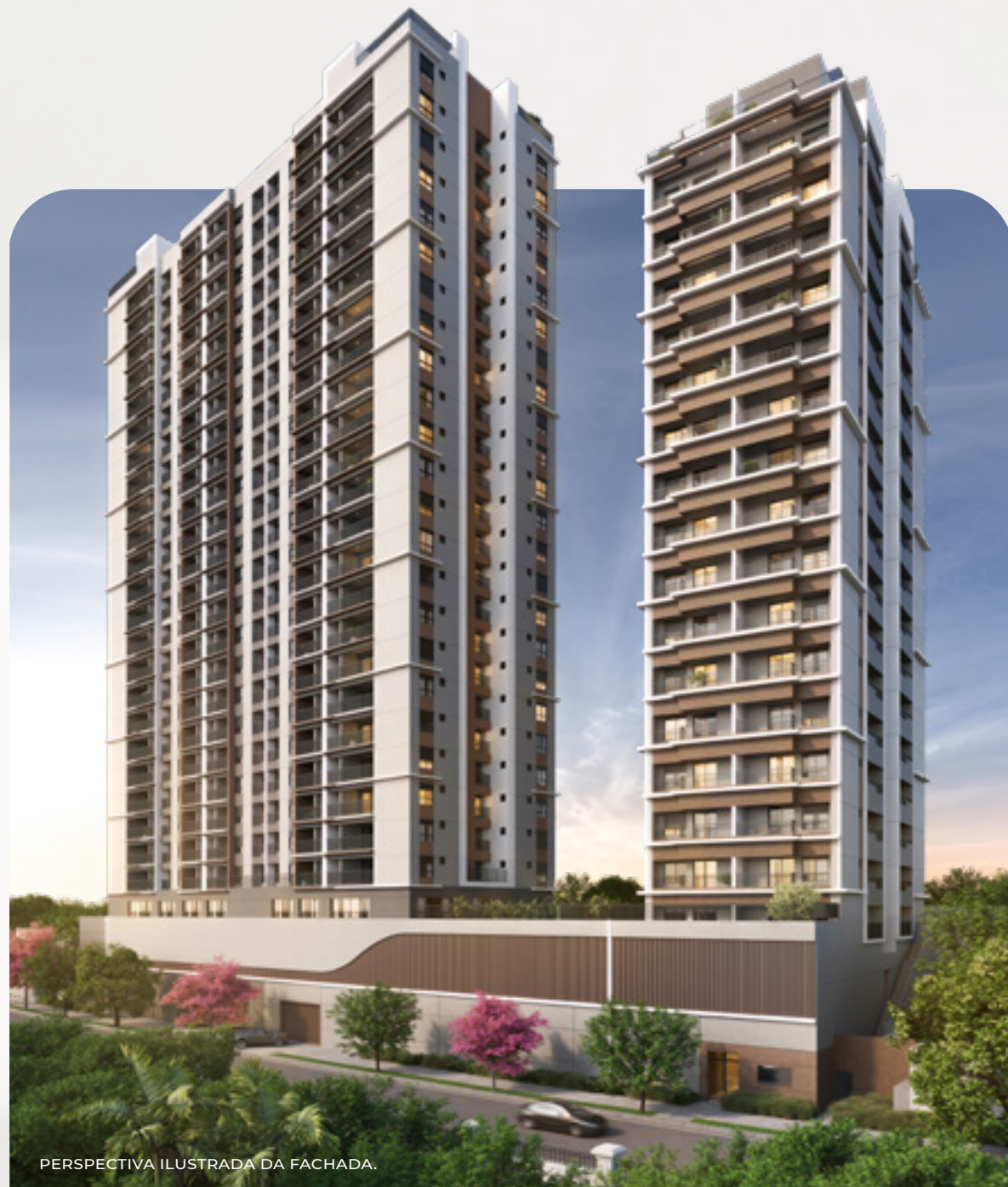
PERSPECTIVA ILUSTRADA DA FACHADA.

Toda história começa em um lugar especial. Essa inicia no encontro dos melhores elementos para alcançar um novo estilo de vida.